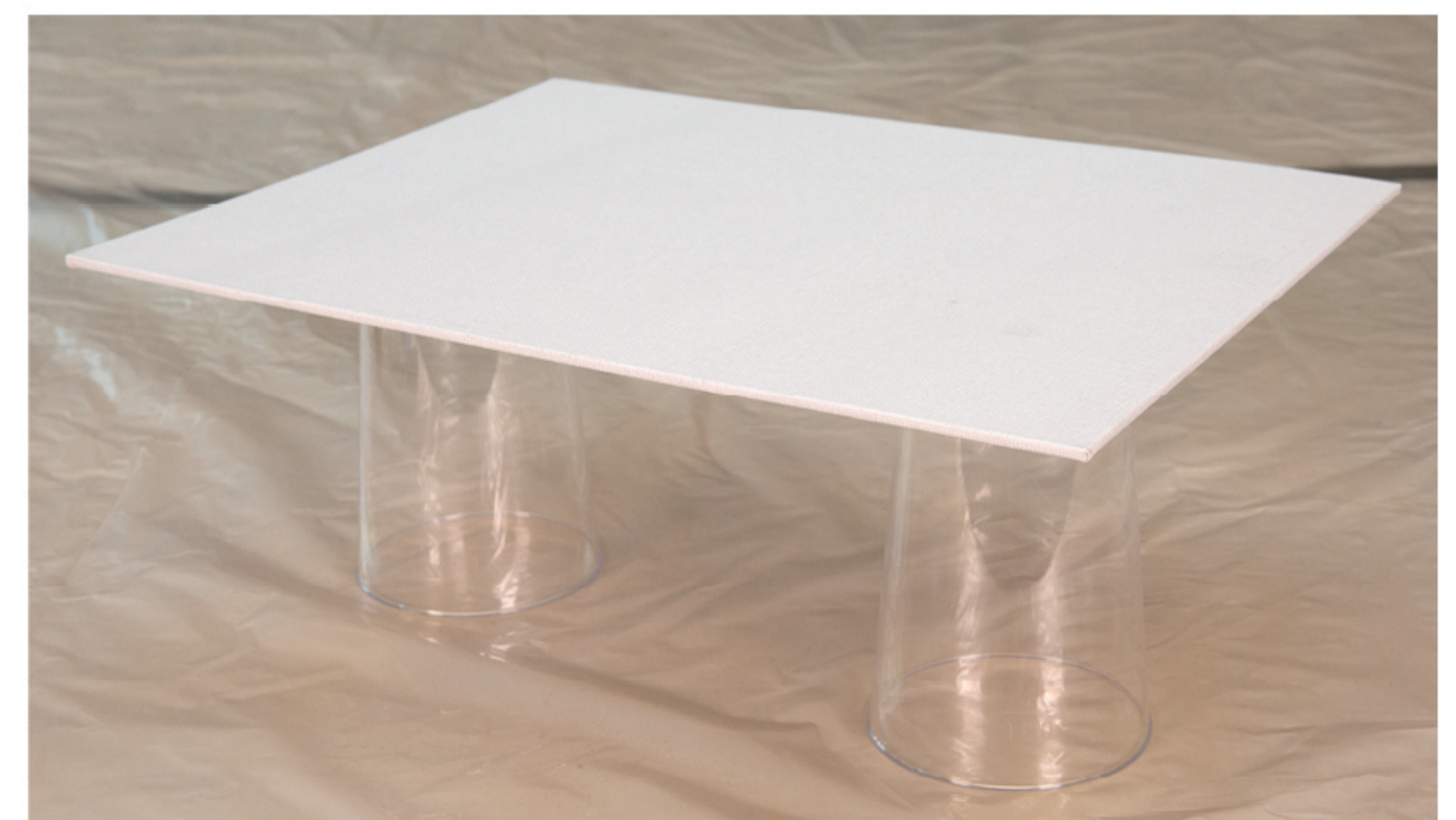
Vorbereitung des Arbeitsplatzes

Wählen Sie einen Ort, an dem das noch nasse Bild mindestens 24 Stunden waagrecht liegend trocknen kann, ohne bewegt zu werden. Decken Sie den Untergrund mit Plastikfolie oder Zeitung ab. Achten Sie darauf, dass Ihre Arbeitsfläche waagrecht ist, sonst fließt Ihnen die Farb-Medium-Mischung beim Trocknen vom Bild. Legen Sie den Malgrund auf die Abstandhalter (damit er nicht am Untergrund kleben bleibt, wenn Farbe überläuft).