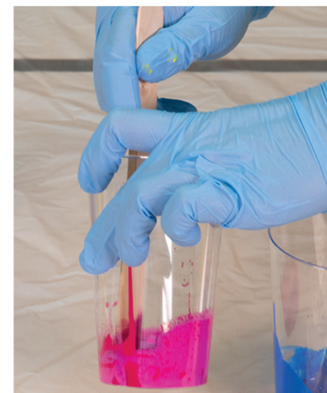
Alles miteinander verrühren