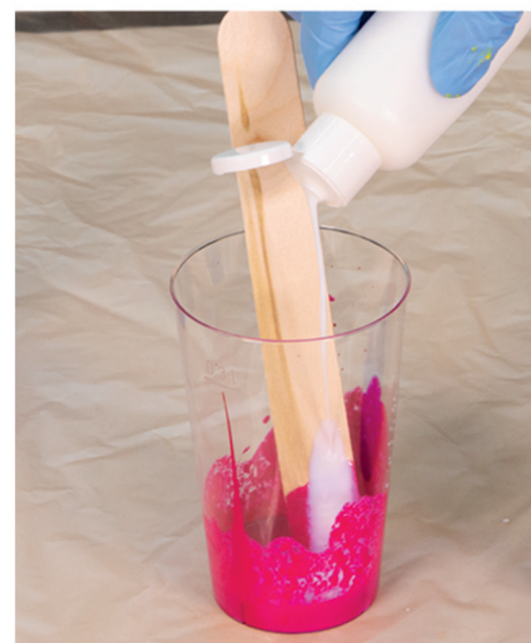
1 Teil Pouring Malmittel hinzufügen