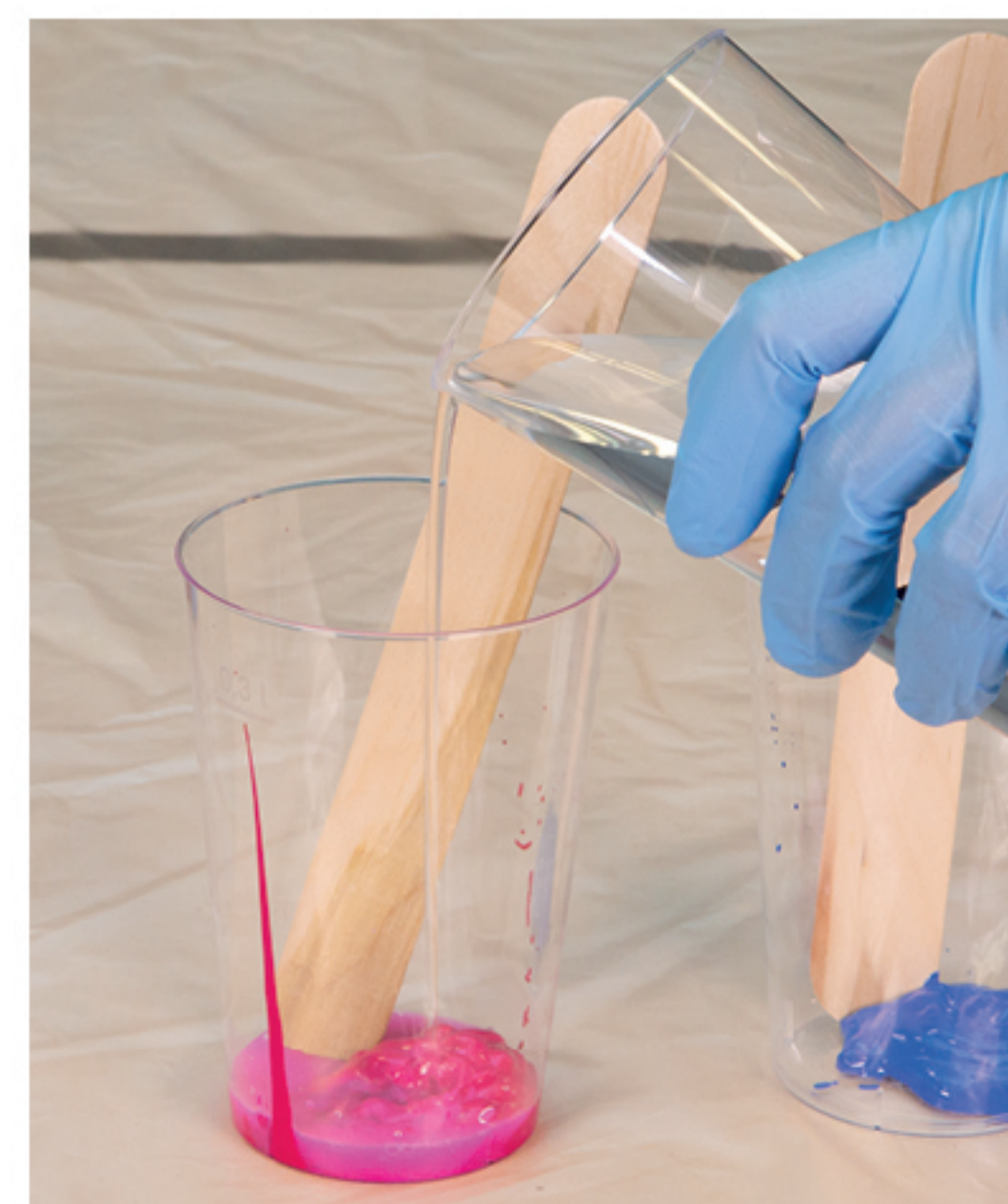
½ Teil Wasser hinzufügen und verrühren