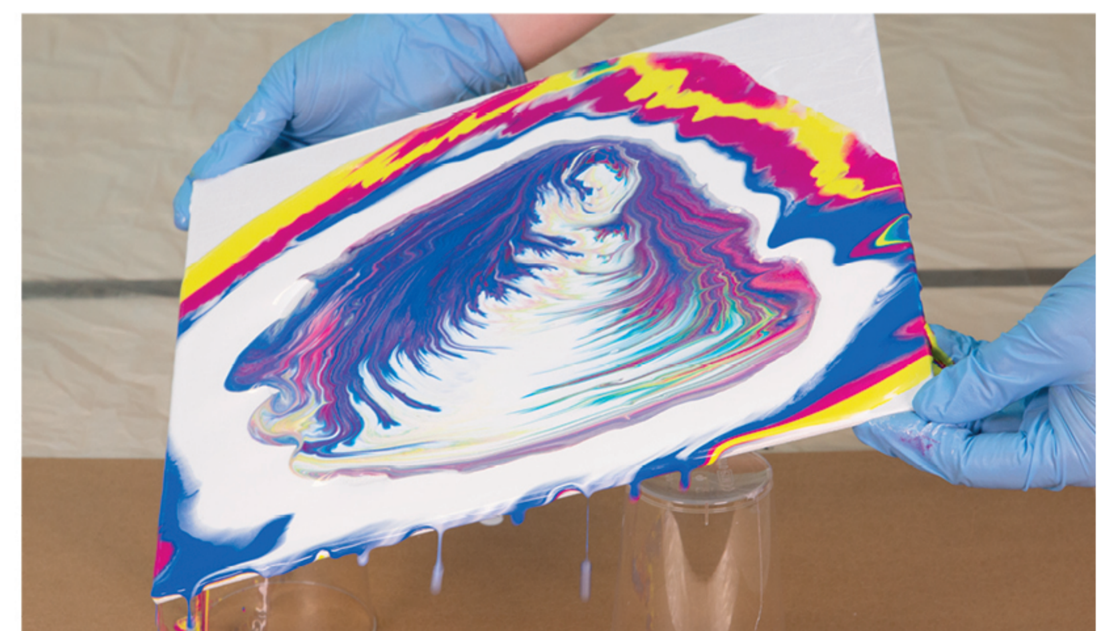
Vorsichtig Hin- und Her-Bewegen

Lassen Sie das Bild ca. 24 h waagrecht liegend trocknen.