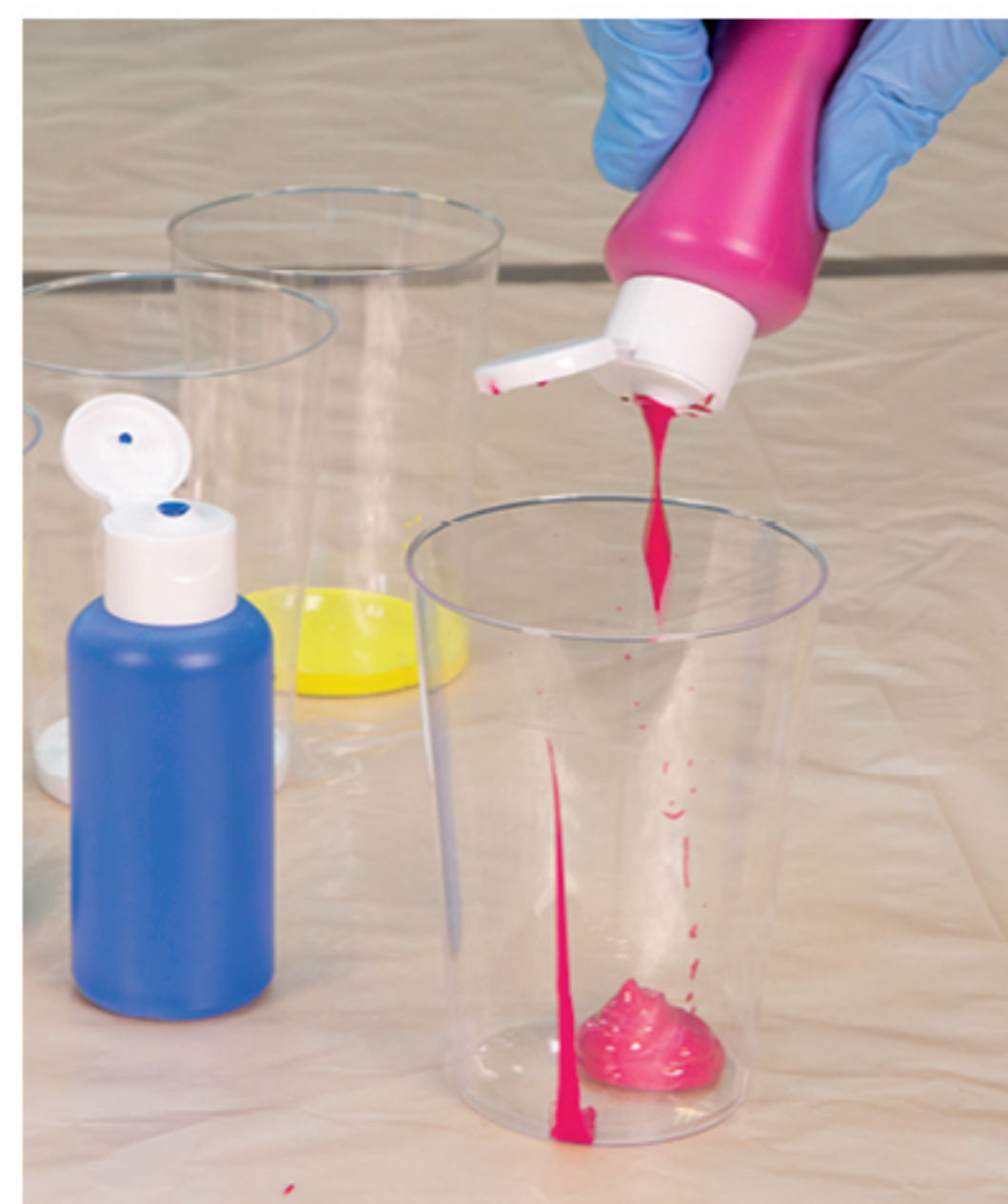
1 Teil Acrylfarbe in den Becher gießen

Das beste Mischungsverhältnis beträgt ungefähr 1 Teil Farbe : ½ Teil Wasser : 1 Teil Malmittel . Füllen Sie die gewählten Farben, den entsprechenden Anteil des Malmittels sowie das Wasser in die verschiedenen Plastikbecher. Rühren Sie die Farb-Malmittel-Wasser-Mischung mit dem Spatel gut um. Je nach Farbton kann dieses Mischungsverhältnis variieren.