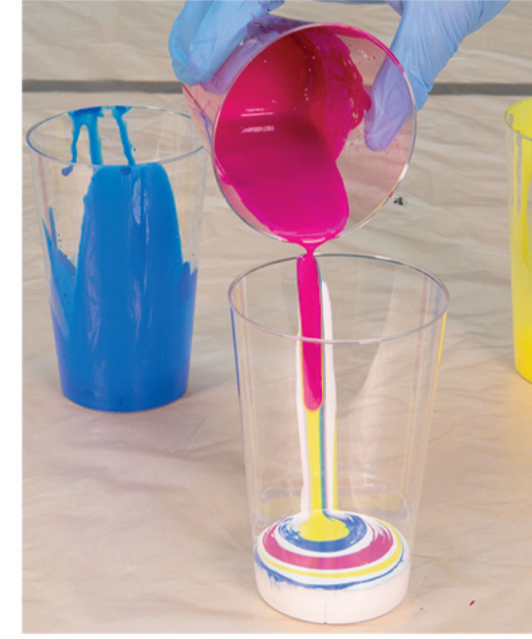
Schichten der Farben im Becher

Ziehen Sie zum Schutz die Handschuhe an. Gießen Sie die Mischungen direkt portionsweise aus den Bechern auf den Untergrund oder schichten Sie die Farben in einem Becher (nicht umrühren) und schütten diese auf den Malgrund. So legen Sie Formen und Farbproportionen an. Gießen Sie kleine Tropfen oder Linien zur weiteren Gestaltung.